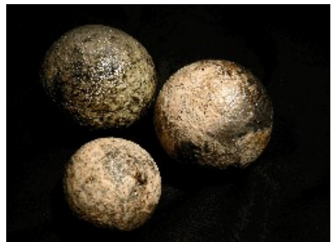
Les planètes, sphères creuses tournées, cuisson raku